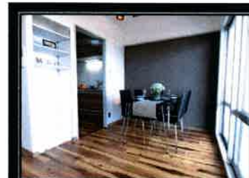
ダイニングルーム(家具付)