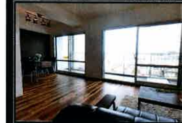
リビングルーム(家具付)