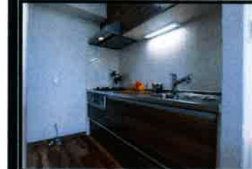
システムキッチン