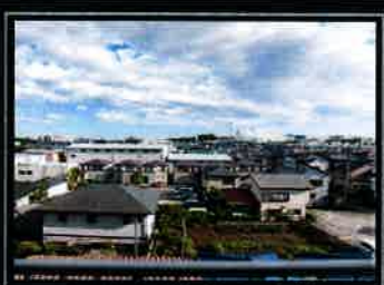
ベランダからの眺望