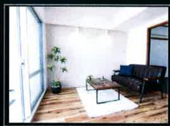
リビングルーム(家具付)