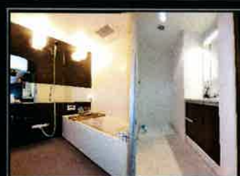
浴室&パウダールーム