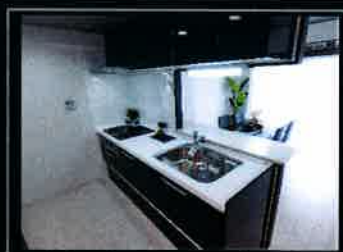
ブラックのシステムキッチン