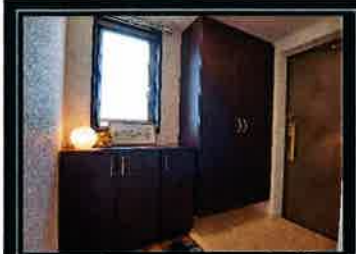
小窓のある明るい玄関