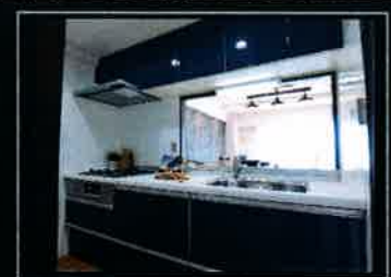
ネイビーブルーのキッチン