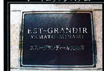
マンションエンブレム