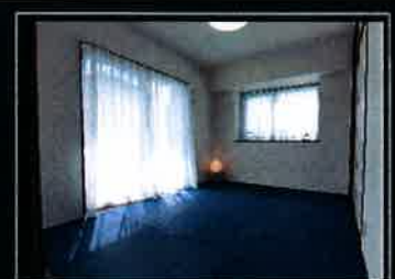
和室は紺の縁なし畳