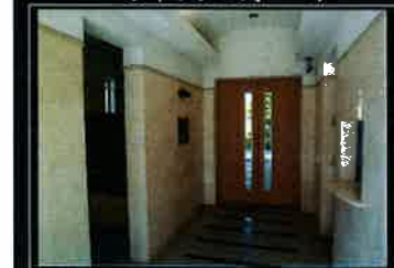
オートロックシステム