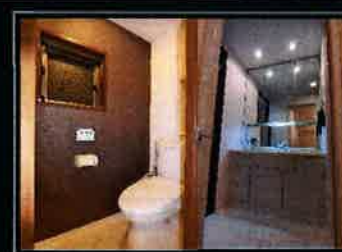
トイレ・洗面化粧台