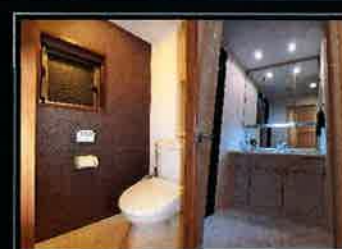
トイレ・洗面化粧台