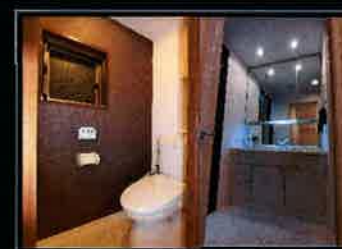
トイレ・洗面化粧台