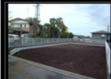
並列2台駐車スペース