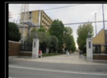
青山学院大学 相模原キャンパス