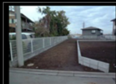
隣切り有り3m通路駐車3台分