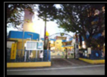
淵野辺ひばり幼稚園