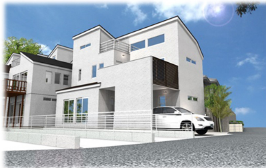
※パースはイメージです。実際のものとは異なります。