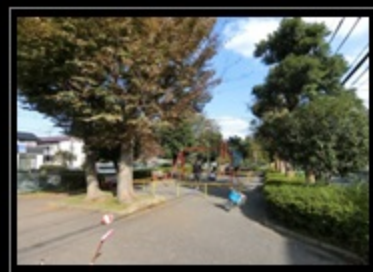
国分第一児童公園