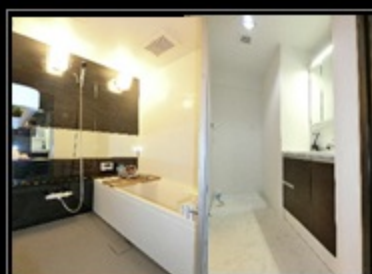
浴室&パウダールーム