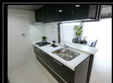
ブラックのシステムキッチン