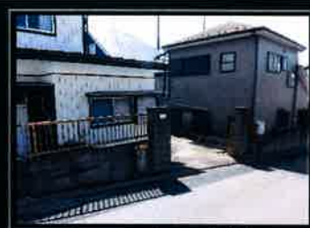
カースペース部分