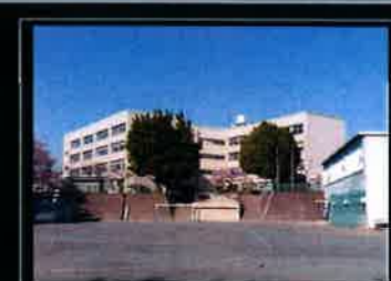
青葉台小学校まで約1350m