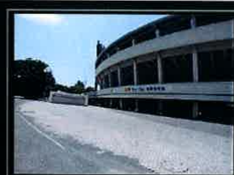
淵野辺公園まで約650m