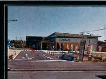
ベジたべーなまで約200m