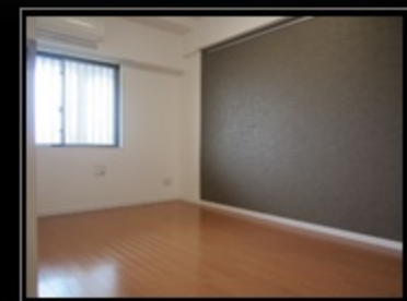
アクセントクロス洋室