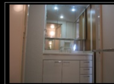
ワイドな洗面化粧台