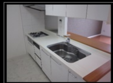
食洗機付のシステムキッチン