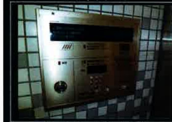
オートロックシステム