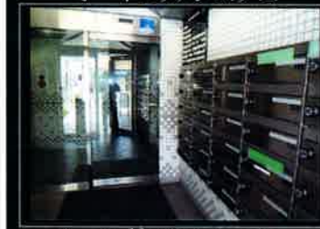
メールボックスコーナー