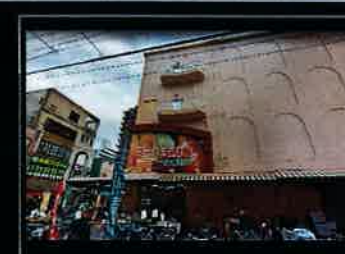
スーパー生鮮館TAIGAまで330m