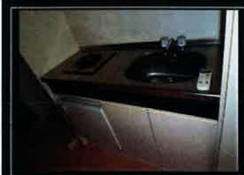
ミニ冷蔵庫付キッチン