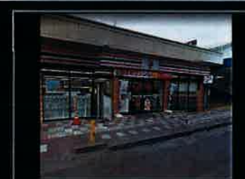
セブンイレブンまで約220m