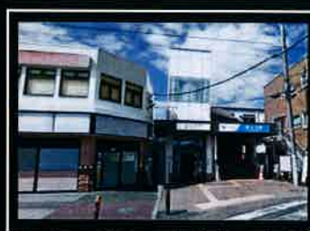
●小田急江ノ島線桜ヶ丘駅