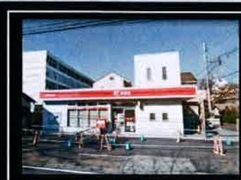
●大和桜ヶ丘郵便局