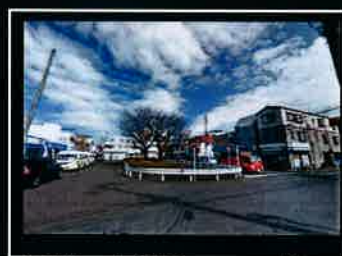
●桜ヶ丘駅東口ロータリー