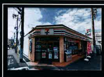
●セブンイレブン大和桜ヶ丘東口店