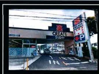
●クリエイティブSD大和上和田店