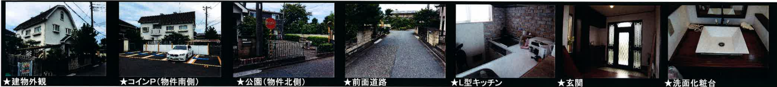
★建物外観 ★コインP(物件南側) ★公園(物件北側) ★前面道路 ★L型キッチン ★玄関 ★洗面化粧台